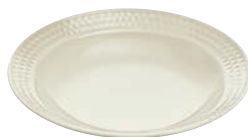
⑭丸深皿 16.5cm D240BR I 乳白・C