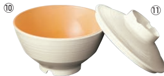
⑩飯碗 中(身) A104BR IOC 乳白/オレンジ・C