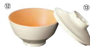
⑫飯碗 小(身) A105BR IOC 乳白/オレンジ・C